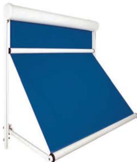
Sombroll EG 40P

Qualquer que seja o modelo escolhido existe opção de comando manual ou eléctrico.